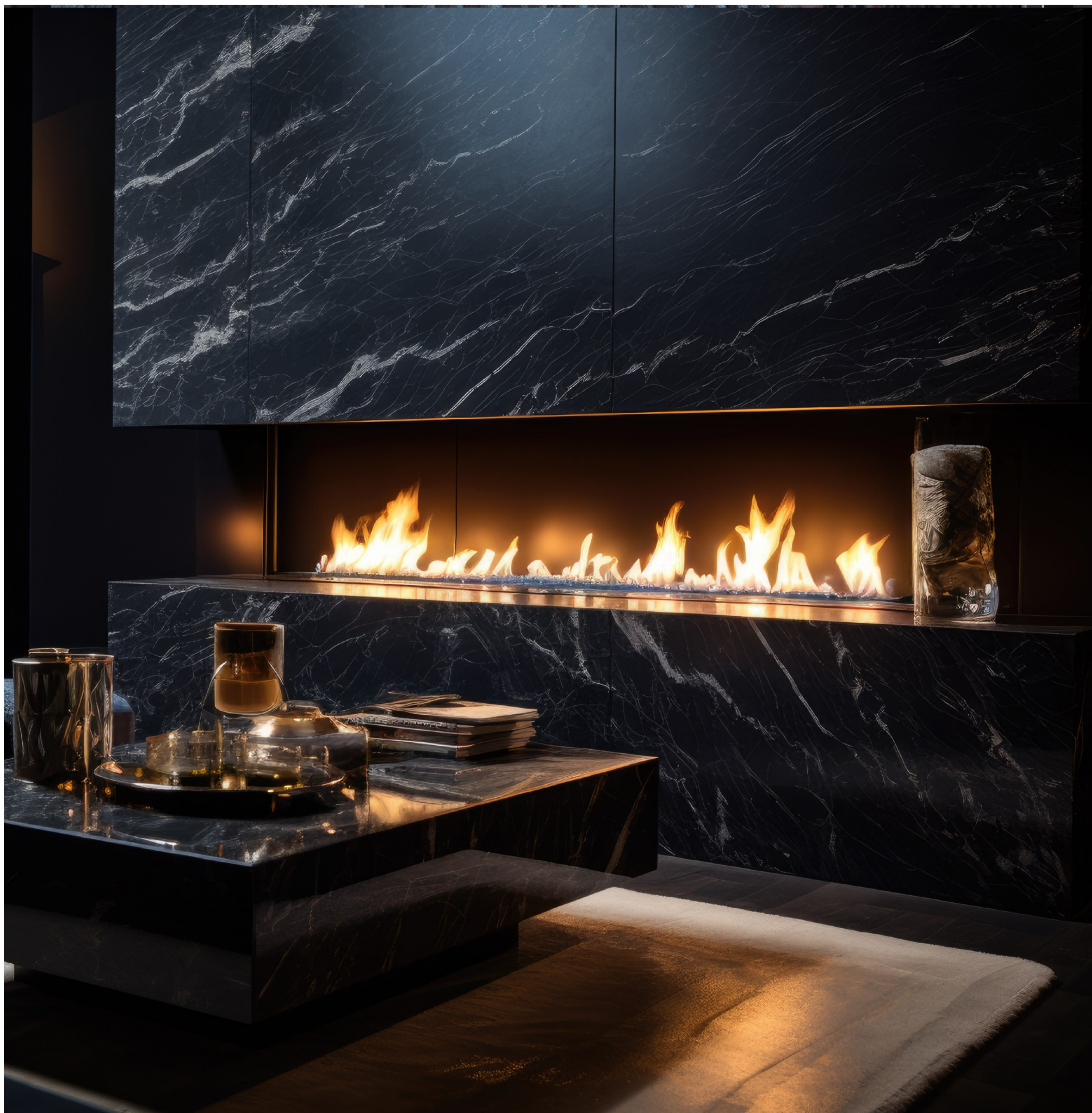
PALNIK Black Burner 1500