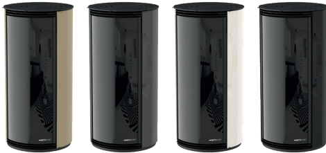
Champagne Champagne - Champagne Champagnier Canna di Fucile Gunmetal - Bronze à Canon Gunmetal - Rotguss Bianco White - Blanc - Bianco - Weiß Nero Black - Noir - Negro - Schwarz