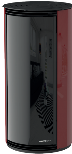
Bordeaux Bordeaux - Bordeaux Bordeaux - Bordeaux