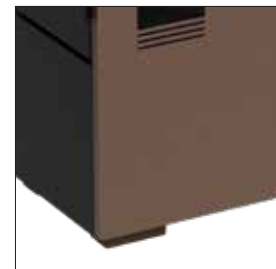
Piedini in legno / Wooden feet Pieds en bois / Holzfüße Pies de madera / Pés de madeira