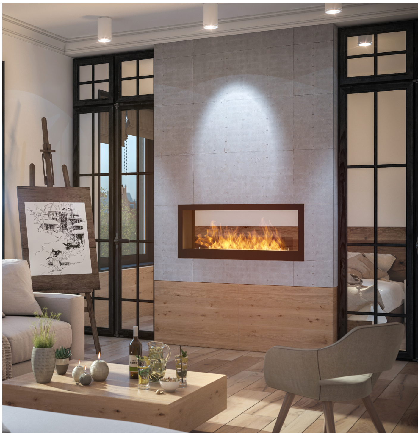
Biokominek 2 Side 1200