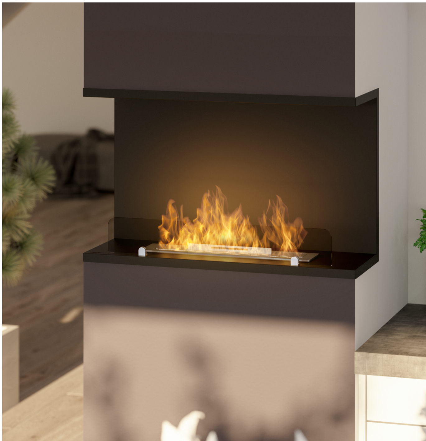
Biokominek Inside C800v2