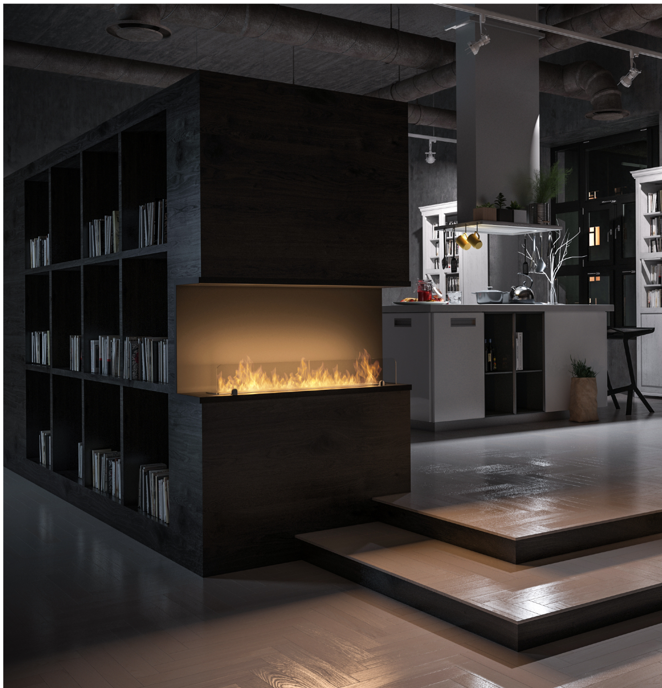
Biokominek Inside C1000v2