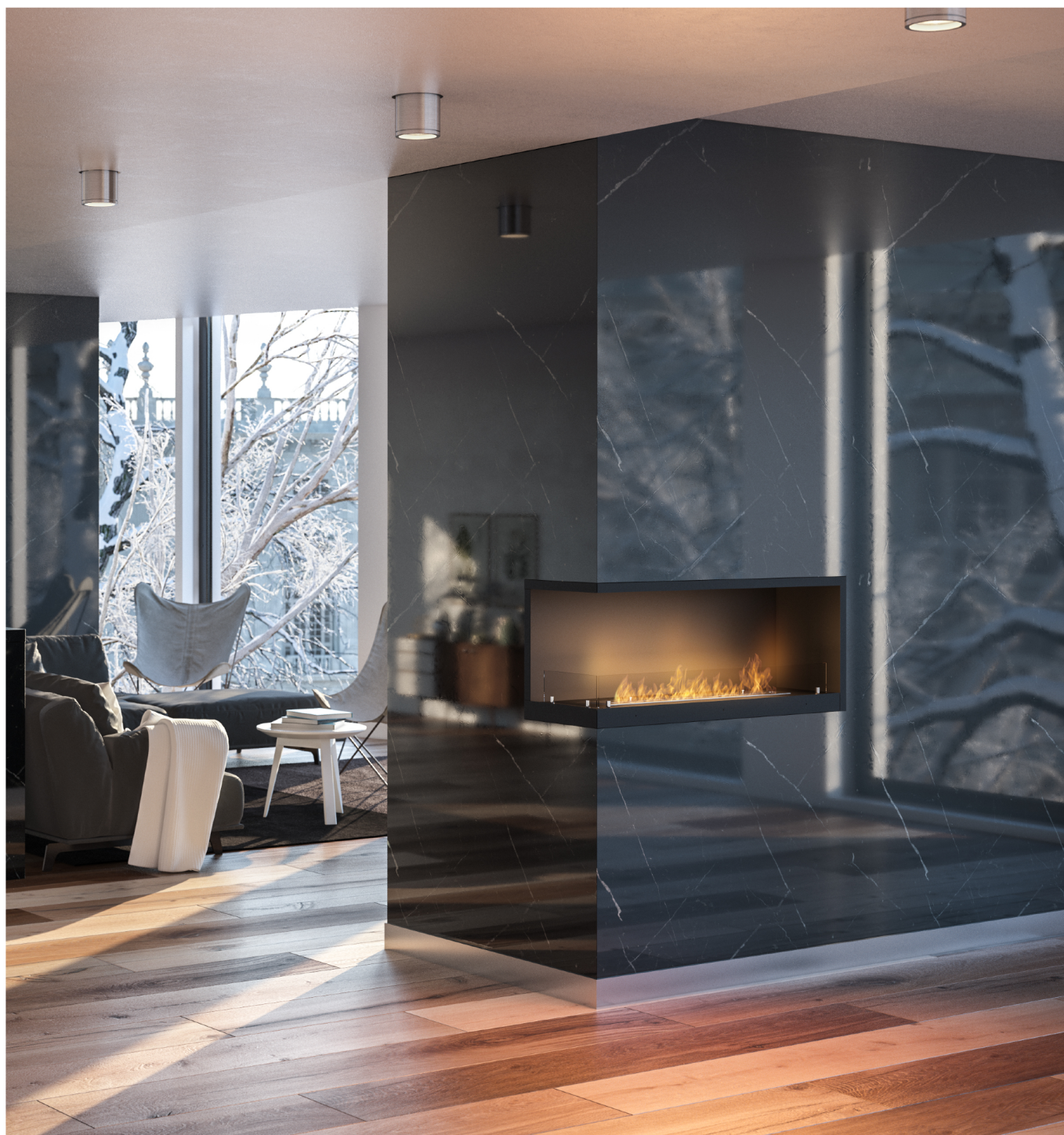
Biokominek Inside L1100v2