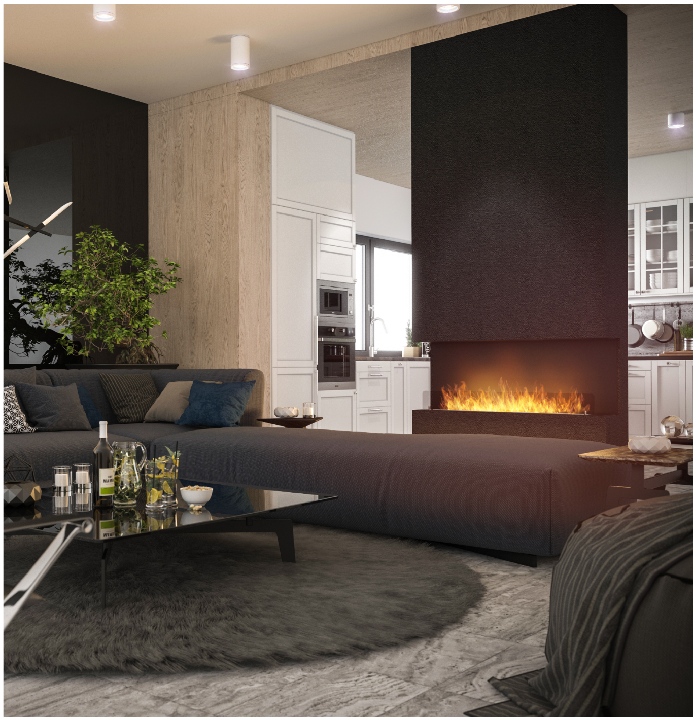
Biokominek Inside C1200v1